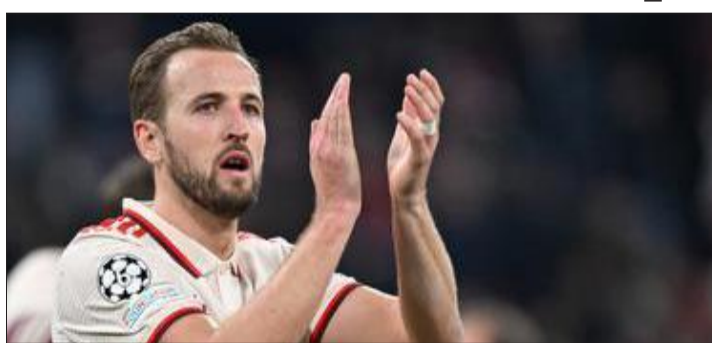
Die Bayern können wieder auf Harry Kane zählen.